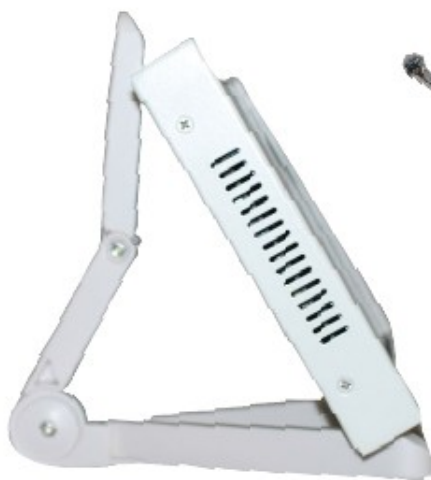
Monitor ze stojakiem stołowym na kaniulę endoskopową